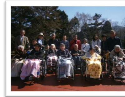
ご家族と一緒に記念撮影