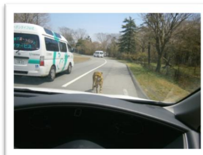
車道にヒョウが出てきてびっくり。

グループホームでは4月25日(火)に富士サファリパークに遠足に出かけました。サファリパークでは車の中から間近にライオンや象を見ることができ、皆さん家族と一緒に楽しいひと時を過ごされました。