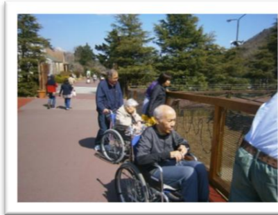
園内をご家族と散策しました。