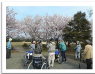
皆さんこれから記念撮影です。