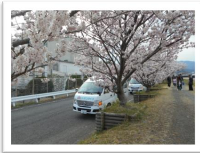
今年は南足柄に出発。

デイサービスでは毎年恒例の桜見学を行いました。今年は南足柄の春めき桜を見に出かけ、皆さん、満開の桜を堪能することができました。