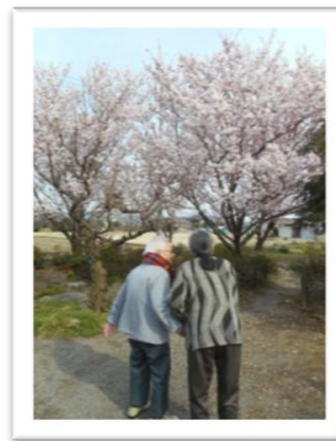
仲良しの二人をパチリ。